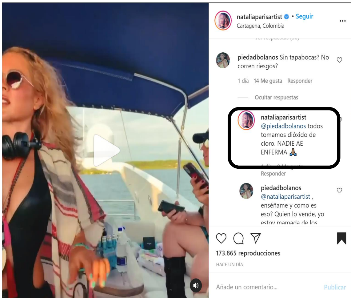
Imagen 1. Cuenta Instagram @nataliapisartist.

En ese orden de ideas, este Despacho inspeccionó diferentes páginas de internet, advirtiendo que en la red social INSTAGRAM, la usuaria @nataliapisartist, recomienda a sus seguidores la ingesta del producto dióxido de cloro, tal como se observa en las siguientes imágenes: