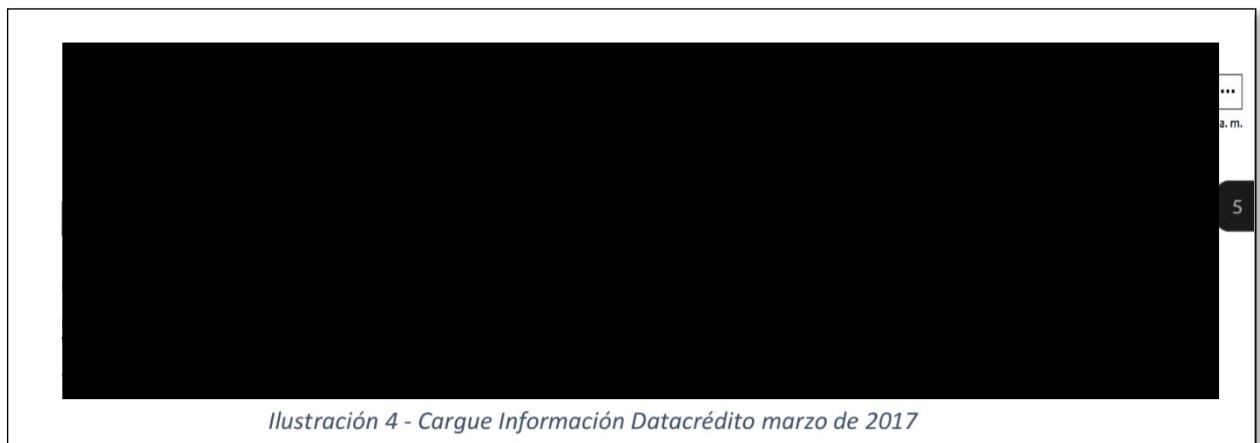
Ilustración 4 - Cargue Información Datacrédito marzo de 2017

Para demostrar lo anterior, remite las capturas de pantalla correspondientes al cargue de Información de DataCrédito y Cifin del mes de marzo de 2017, veamos: