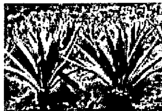
Plantas de fique

El fique es cultivado en el municipio de Guacamayas y en las veredas aledañas circunscritas a la zona geográfica descrita en el acápite 1.1. de esta resolución. El proceso inicia con el corte, una a una, de las pencas maduras de la planta de fique, las cuales deben ser sostenidas verticalmente, con el fin de efectuar dos cortes paralelos que permitan retirar el borde espinoso.