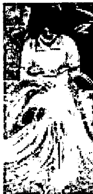
Separación de las fibras

Este proceso ayuda a que salga la coloración natural que trae el fique y a que la fibra se abra, con el fin de que el color que se aplique con posterioridad se fije mejor.