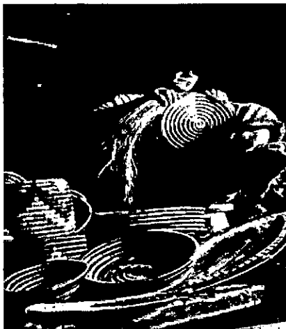
Tejido en espiral