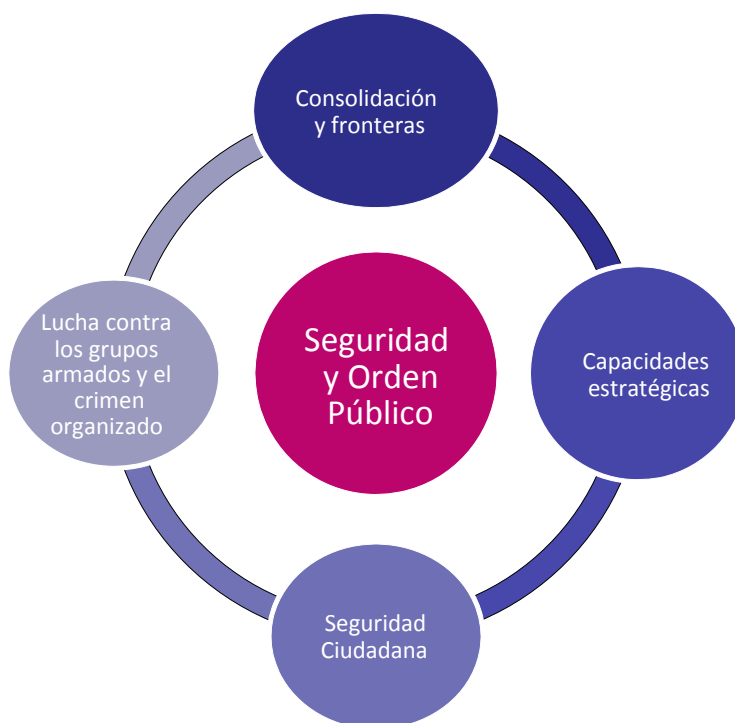
Figura V-1. Lineamientos estratégicos para consolidar la seguridad

Ahora bien, la eficiencia de la justicia no sólo es fundamental para el cumplimiento de los derechos ciudadanos. También es un requisito esencial para promover la inversión y el crecimiento económico. La eficiencia y credibilidad del sistema judicial de un país es uno de los factores de mayor impacto sobre el desarrollo de las actividades económicas.