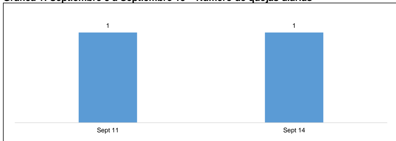
Gráfica 1: Septiembre 8 a Septiembre 15 – Número de quejas diarias