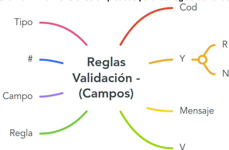
Figura No. 2: Convenciones empleadas para las reglas de validación